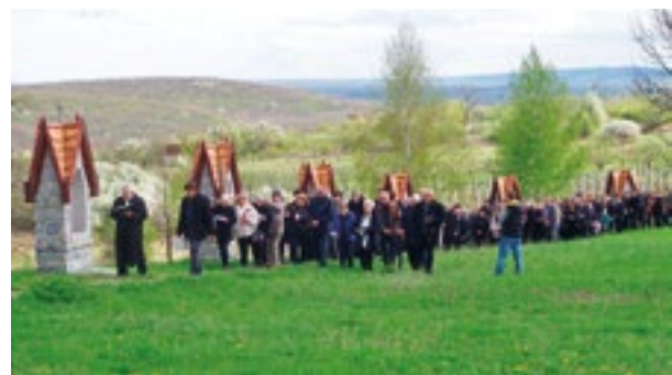
A keresztútjárat résztvevői a Császa-szőlőhegyen.

a tizennegyedik századtól a tizenegy állomásos forrasztás módját XII. Kelemen pápa szabályozta és egységesítette 1731-ben kiadott rendeletében.