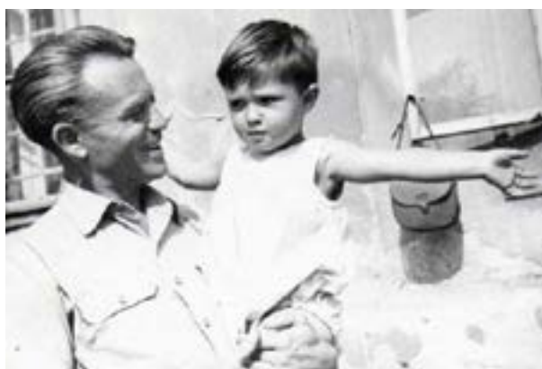
Apa és fia