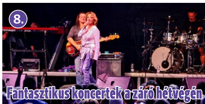
Fantasztikus koncertek a záró hétvégén