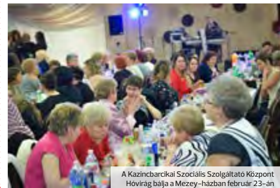
A Kazincbarcikai Szociális Szolgáltató Központ Hóvirág bálja a Mezey-házban február 23-án