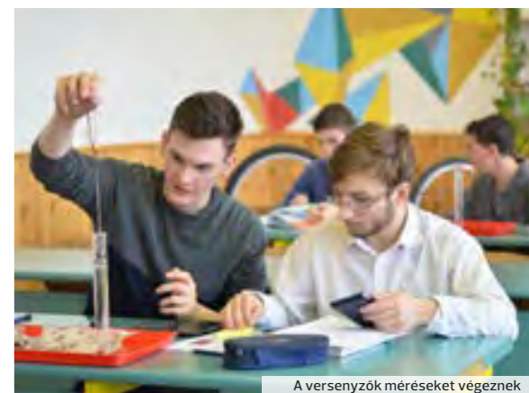
A versenyzők méréseket végeznek

eni Református Kollégium Dóczy Gimnáziuma nyerte, megelőzve a miskolci Földes Ferenc és a Herman Ottó Gimnáziumot.