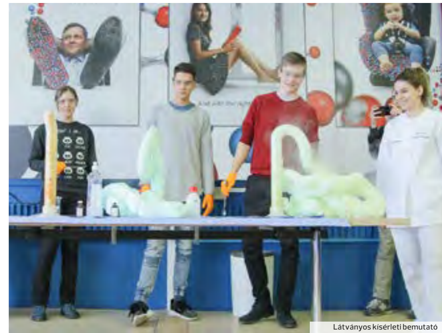
Látványos kísérleti bemutató

A fakultáció célja egyrészt a kémiaérettsé-