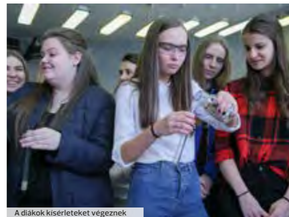
A diákok kísérleteket végeznek

gi-vizsgára való felkészítés, másrészt olyan korszerű gyakorlati laborismeretek átadása, amelyek korszerű, piacképes tudást és gyakorlatot biztosítanak majd a későbbiek során, akár mérnökként, akár középfokú szakképzett-ségű szakemberként. A vegyészeti ismeretek fakultációjának első há-