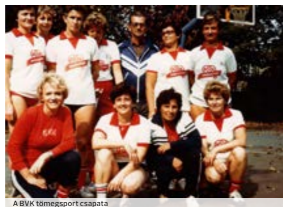
A BVK tömegsport csapata