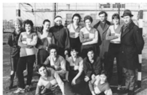
A kézilabdacsapat a Széplaki házaspárral