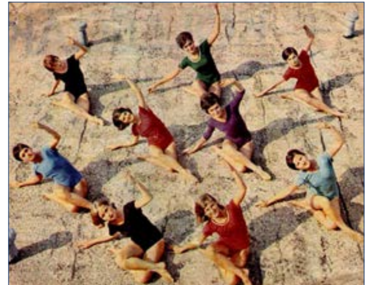
1967-ben a színes Nők Lapja is írt erről a remek csapatról