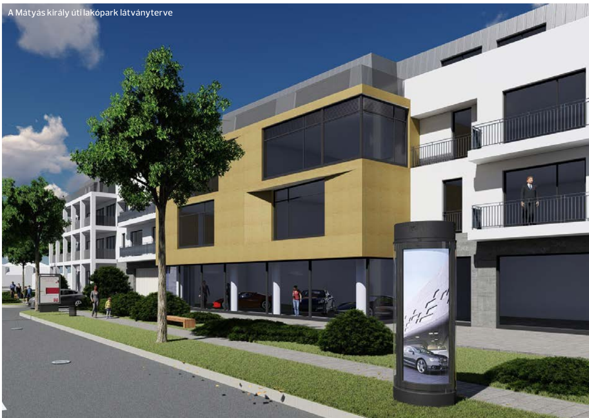
A Mátyas király uti lakópark látványterve