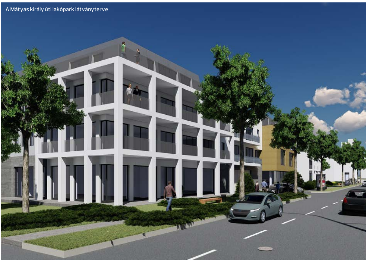
A Mátyas király uti lakópark látványterve

szem előtt tartja – hangsúlyozta a városvezető bevezetőjében. A Green Plan Energy Kft. tulajdonosai immár 20 éves vállalkozói karrierjük alatt jó pár évet eltöltöttek építőipari kivitelezések menedzselésével, így nem kellett anulláról felfedezve elindulni a területen. A cég már meglévő korábbi kapcsolati hálójára támaszkodva, új építésű modern társasházakba kezdte beépíteni a saját kapacitásában legyártott napelemes rendszereit. Jelenleg egy ilyen társasház építése zajlik a Nyárfa