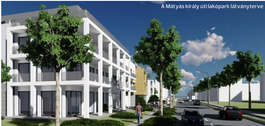
A Mátyas király uti lakópark látványterve

Új építésű okosotthonokkal, és egy minden ízében 21. századi 63 lakásos belvárosi társasházzal pezsdítene fel Kazincbarcika ingatlanpiacát a Green Plan Energy Kft., amely hagyományos napelemgyártással és telepítéssel foglalkozik, az utóbbi években azonban portfóliójukat kiterjesztendő energiatakarékos otthonok építésével is foglalkozni kezdtek.