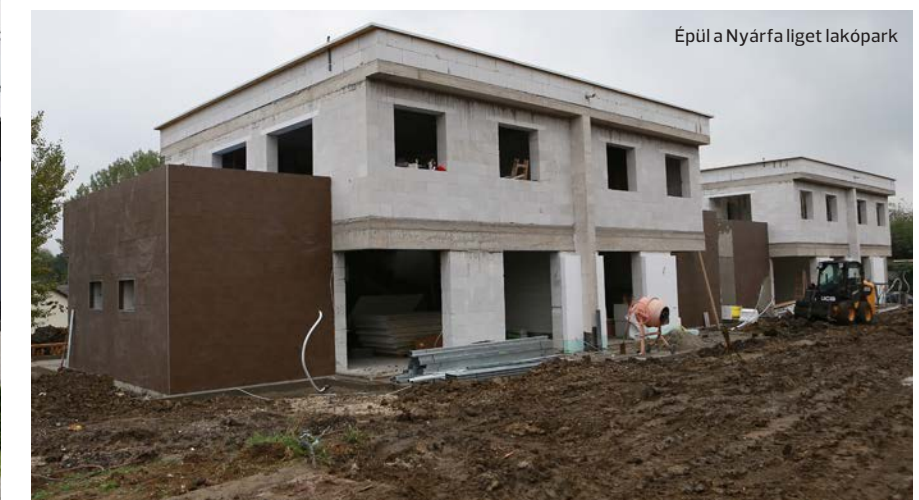
Épül a Nyárfa liget lakópark

ruházást kíván megvalósítani két ütemben a cég, melynek révén akár száz embernek biztosíthat az üzem új munkahelyeket. Az előttünk álló három év alatt egy logisztikai központot, valamint egy új gyárcastrnokot terveznek építeni, melyben az általuk tervezett napkollektorok gyártását végzik majd. A most bejelentett építkezések pedig várhatóan újabb és újabb munkahelyeket hoznak majd létre a városban és vonzáskörzetében, arról nem is beszélve, hogy végre lehetőséget kínál az érdeklődőknek, hogy új építésű társasházakban kössenek le majd maguknak lakásokat, amelyek várhatóan 2022-re kerülnek majd kulcsra-kész állapotban átadásra.