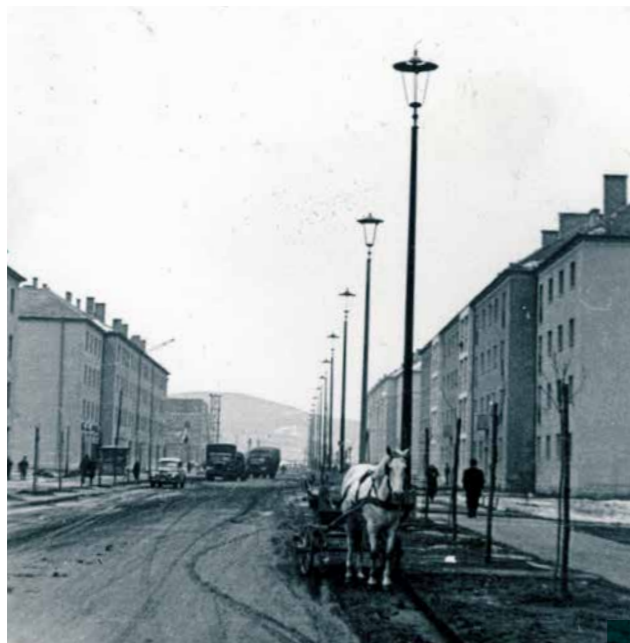
1956 Egressy Béni (Lenin) út a Szabadság tér felé nézve. Fotó: Fortepan / Márk Iván