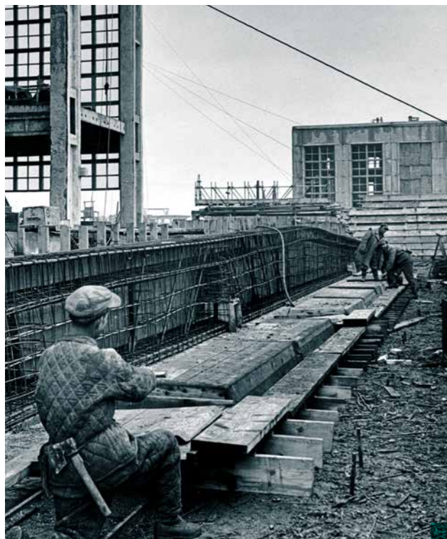
A Borsodi Hőerőmű építkezése. A helyszínen előregyártott, vasbeton födémgerenda vasalata és zsaluzata. 1954