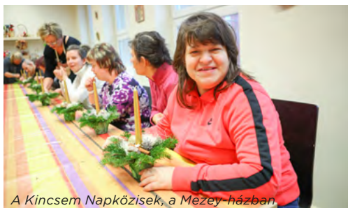
A Kincsem Napközisek, a Mezey-házban.

sal, valamint közbenjár az érdekvédelmi feladatok ügyintézésében azok esetében, akik önmaguk ellátására nem képesek és róluk más nem gondoskodik. Mindezekben felül a szociális étkeztetés keretében napi egyszeri meleg étkezés jár azoknak, akik erről életkoruk, egészségi állapotuk miatt nem képesek önmaguknak gondoskodni. Igény esetén házhoz szállítással is.