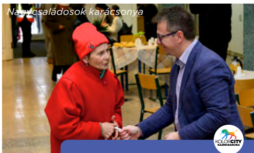
Nagy családosok karácsonya