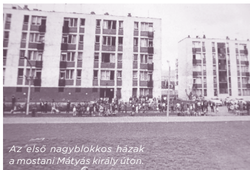
Az első nagyblokkos házak a mostani Mátyás király úton.

épült – idén 50 éves – kórház épülete, valamint a Pollack Mihály úti toronyházak. Ezek előbb egy vasbeton vázszerkezetet kaptak, majd ezután építették meg a falakat nagyblokkokból, majd a lakások szobáinak az elválasztó falait téglából.