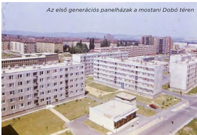
Az első generációs panelházak a mostani Dobó téren