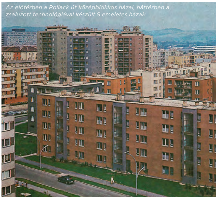
Az előtérben a Pollack út középblokkos házai, háttérben a zsaluzott technológiával készült 9 emeletes házak.

évek között épült fel az Újvárosi rész, mely az 1950-es években még ritkaság számba ment. Ezen kívül állandóan kísérleteztek, melynek nyomai Kazincbarcikán még mindig megtalálhatóak. Így országos szinten is elmondható, hogy sok „legelső” épület került városunkba.