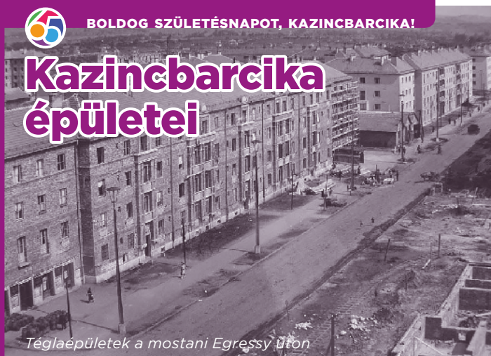
Téglaépületek a mostani Egressy úton

Kazincbarcika építésének nemcsak a története, hanem megvalósulása is érdekes. A különböző, beépítésre szánt területeket ún. szomszédsági egységeknek nevezték. Ezeket a szomszédsági egységeket – a továbbiakban nevezzük őket negyednek – mindegyike magán viseli a korszak építészeti technológiájának a jegyeit, így nagyon jól elkülöníthetőek a városban.