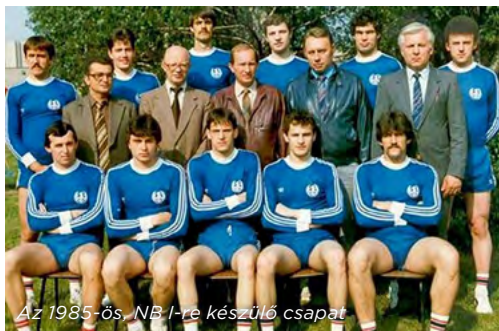
Az 1985-ös, NB I-re készülő csapat

Az évtized végére már, mint a honi röplabdázás egyik fellegváraként tekintettek Kazincbarcikára, ami jó alapot jelentett az 1997 októberében megalakult VRCK eredményes munkájához.